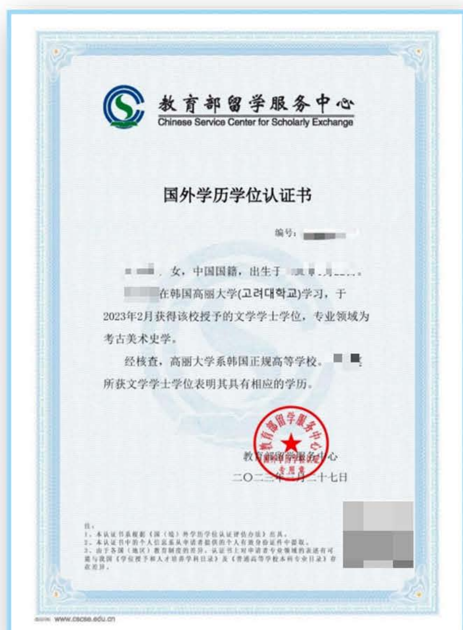
学历学位认证书样本