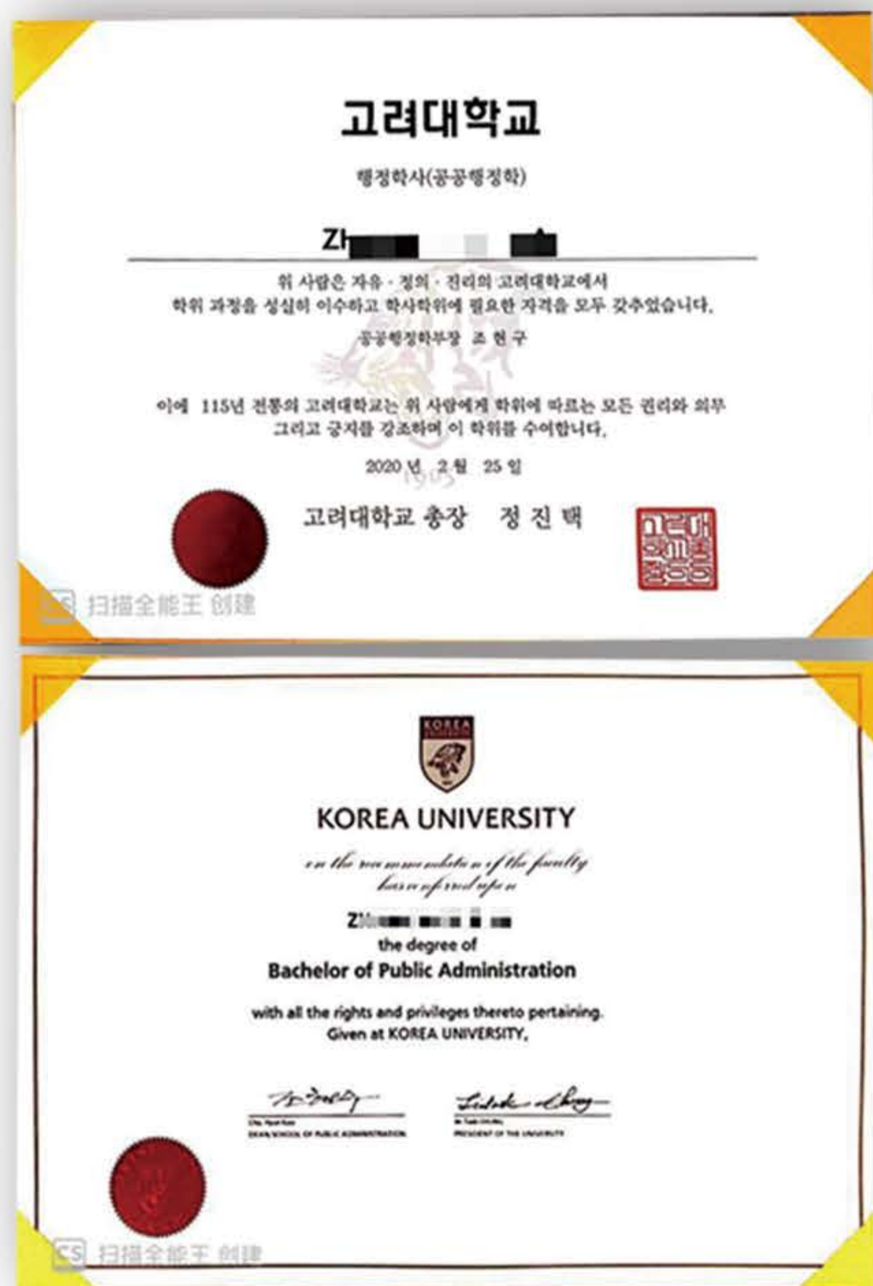
高丽大学毕业证书样本

项目学生在江西师范大学学习语言课程，语言等级达标后或选择无须语言要求专业进入国外合作大学继续学习，按照国外院校要求完成本科学业，可获得国外院校学士学位。有意继续深造者可继续申请攻读国内外硕士研究生课程，获得硕士学位。项目学生获得的国外学历学位可在中国（教育部）留学服务中心进行认证，与国内大学毕业生所获学历学位证书具有同等效力。毕业生归国后可办理留学人员回国工作就业报到证，享受海外高层次人才待遇。可根据北京、上海、广州等一线城市留学归国人才相关条例享受落户、就业及税务减免等优惠政策。