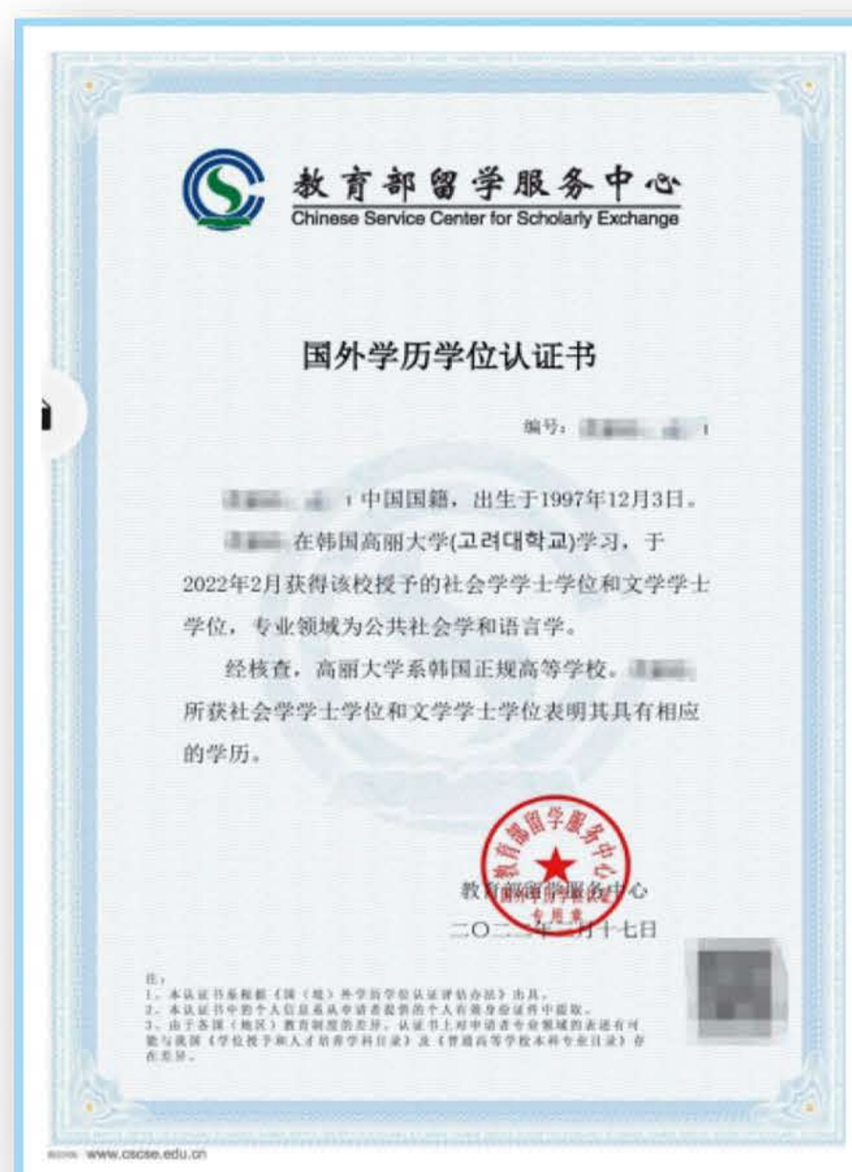
双学位学历认证书样本