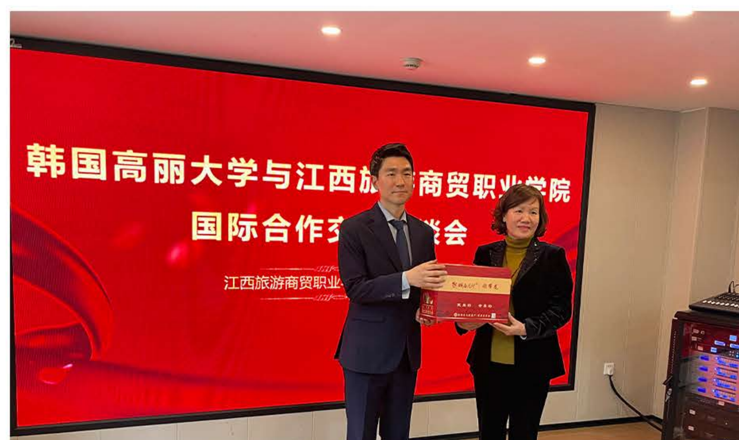
▲ 韩国高校来访我省专科院校