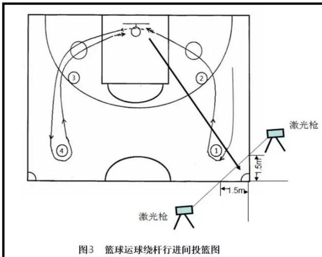
图3 篮球运球绕杆行进间投篮图